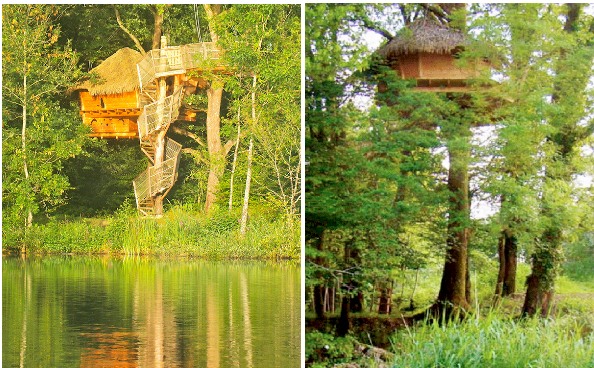
Exemples d'installations de cabanes perchées qui s'insèrent discrètement dans le paysage.

En outre, l'accès aux cabanes et leur éventuelle desserte par les réseaux s'effectueront depuis les cheminements existants sur le parcours golfique et sur le réseau électrique et le réseau d'eau déjà utilisés pour le golf.