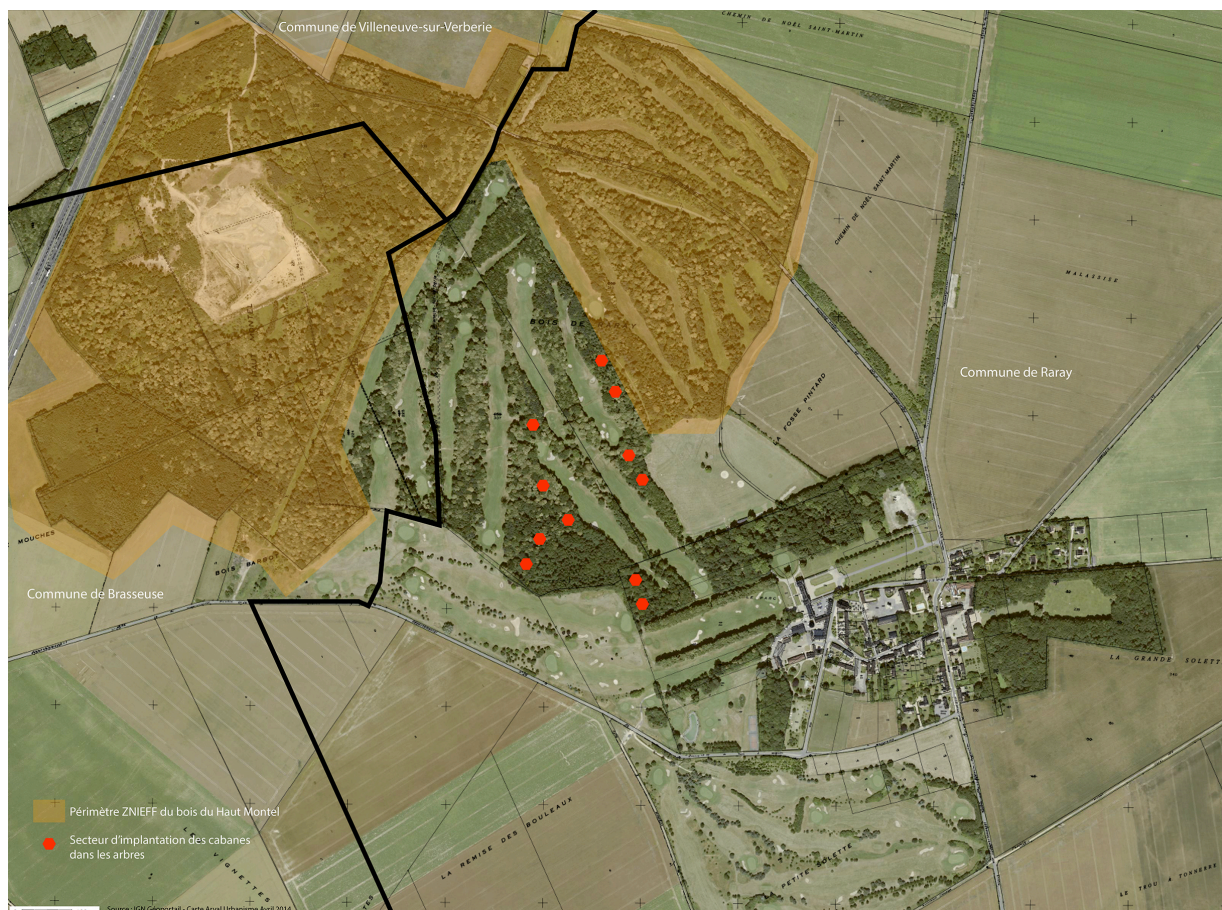
Périmètre de ZNIEFF et secteur d'implantation des cabanes dans les arbres.

Globalement, le secteur identifié pour accueillir les cabanes occupe une seule partie contenue à l'échelle de l'ensemble de l'emprise du domaine golfique, ce qui facilite l'adaptation des dispositions réglementaires du PLU. Le secteur ainsi identifié est délimité en zone naturelle (secteur Ng).